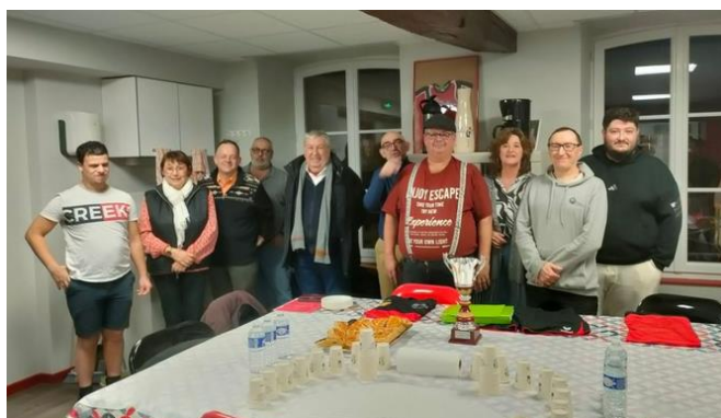
Le nouveau comité directeur