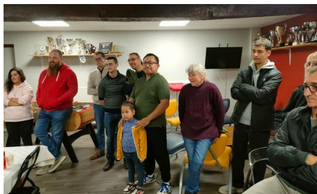
Une partie de l'assistance